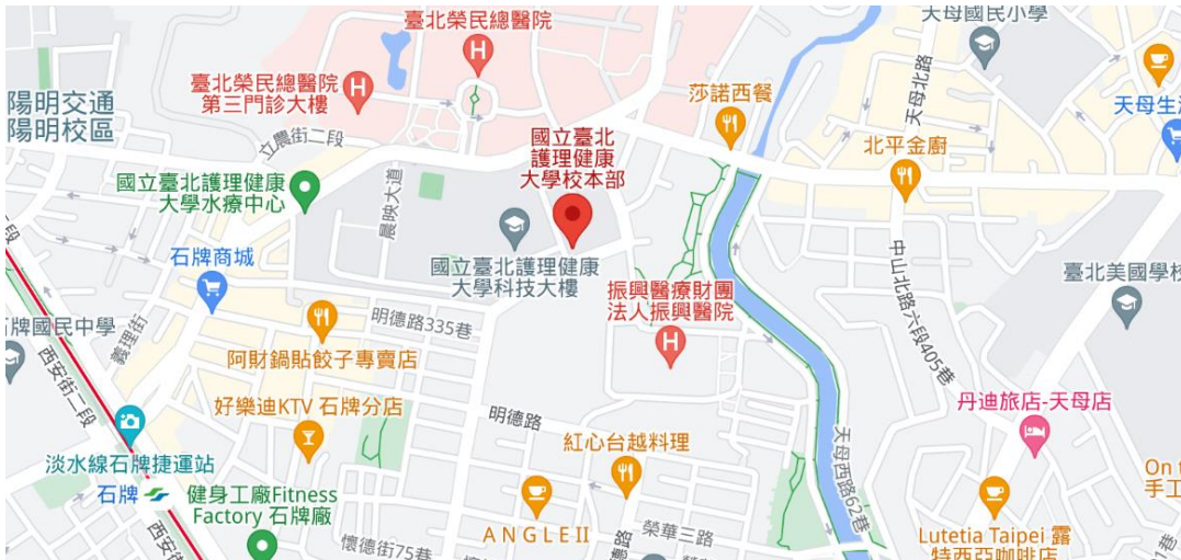
國立臺北護理健康大學校本部地圖 Map of NTUNHS, Main Campus